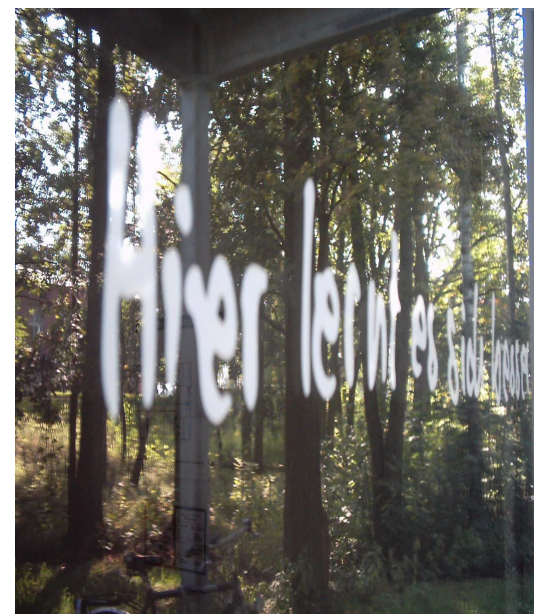
Das Logo der Seeschule Rangsdorf